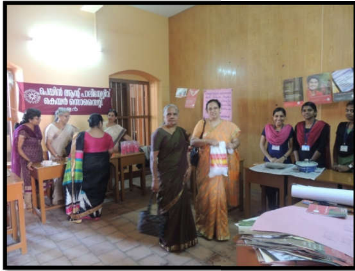
Alumnae stall in “Marian Monsoon fest” on 4 th and 5 th August, 2016- Sale of unused gift items, bags, soaps and degradable sanitary napkins.