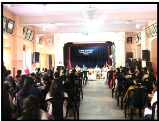
Principal Welcoming the Annual Alumane meet 2016