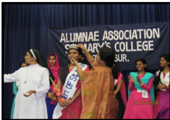
Alumnae secretary crowning the Gem of ST. Mary's