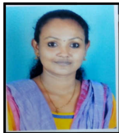
Flowarin A D (2004-07) PhD: "Export of Indian Engineering goods since liberalization"