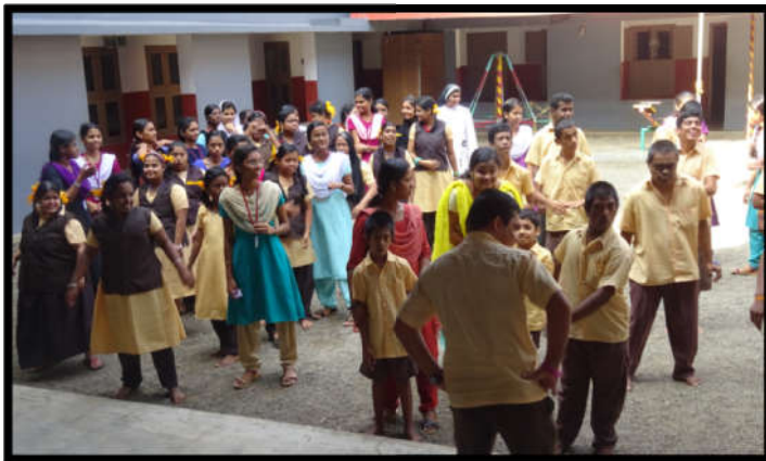
Alumnae visited Carmel Mount Special school, Mullurkara on 15-11-2016

Contributed an amount of Rs. 30000/- towards instituting scholarships for the student achievers of the department of BBA and BSW