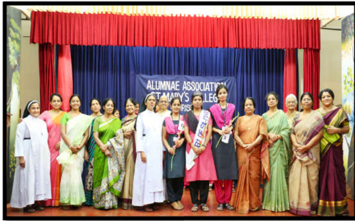
Gem of St. Mary's winners along with Principal and Alumnae