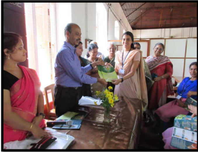
Release and Distribution of pamphlet of health drink preparation to the students