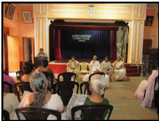
Alumnae secretary presenting the report