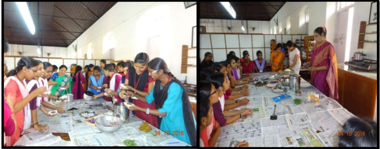
Annual get together 2016