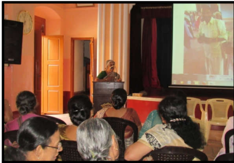
Editor of Reverie addressing the Gathering