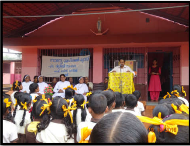
Vote of thanks delivered by PTA president in eye camp

Contributed an amount of Rs. 30000/- towards instituting scholarships for the student achievers of the department of BBA and BSW